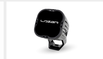
BLACK LENS COVER