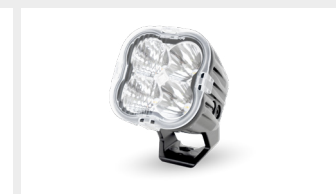
DIFFUSER LENS COVERS