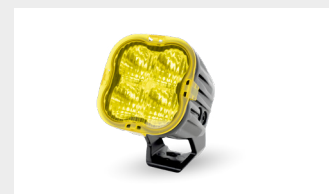
AMBER LENS COVERS